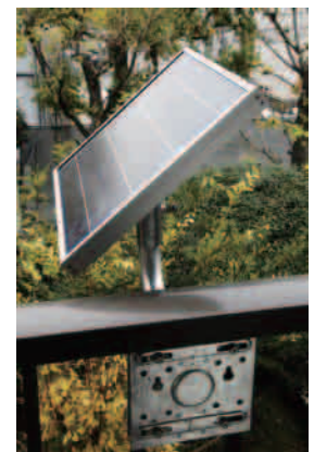
ソーラーパネル取り付け架台