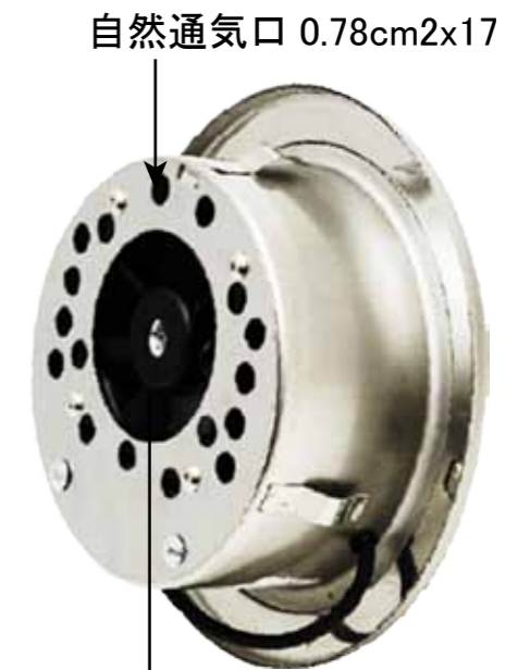
高風量DCファン 期待寿命 40000 時間 1日5時間稼動 21年間寿命