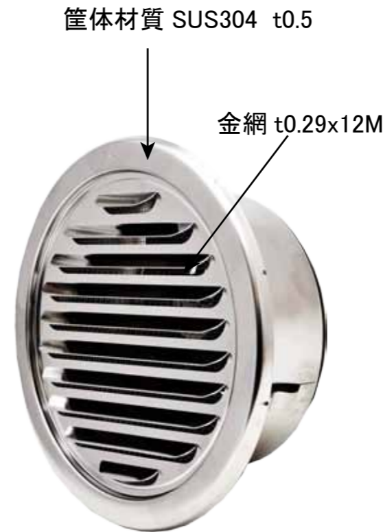
平型150換気扇本体 ステンレスガラリ型 ダクトの取り付けが簡単