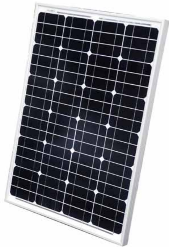
単結晶50Wソーラーパネル 期待寿命25年 (定格出力80%を維持)