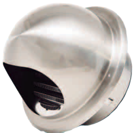
ステンレス製自然換気口(ガラリ)