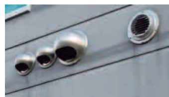
ガラリ内に高効率なDCファン